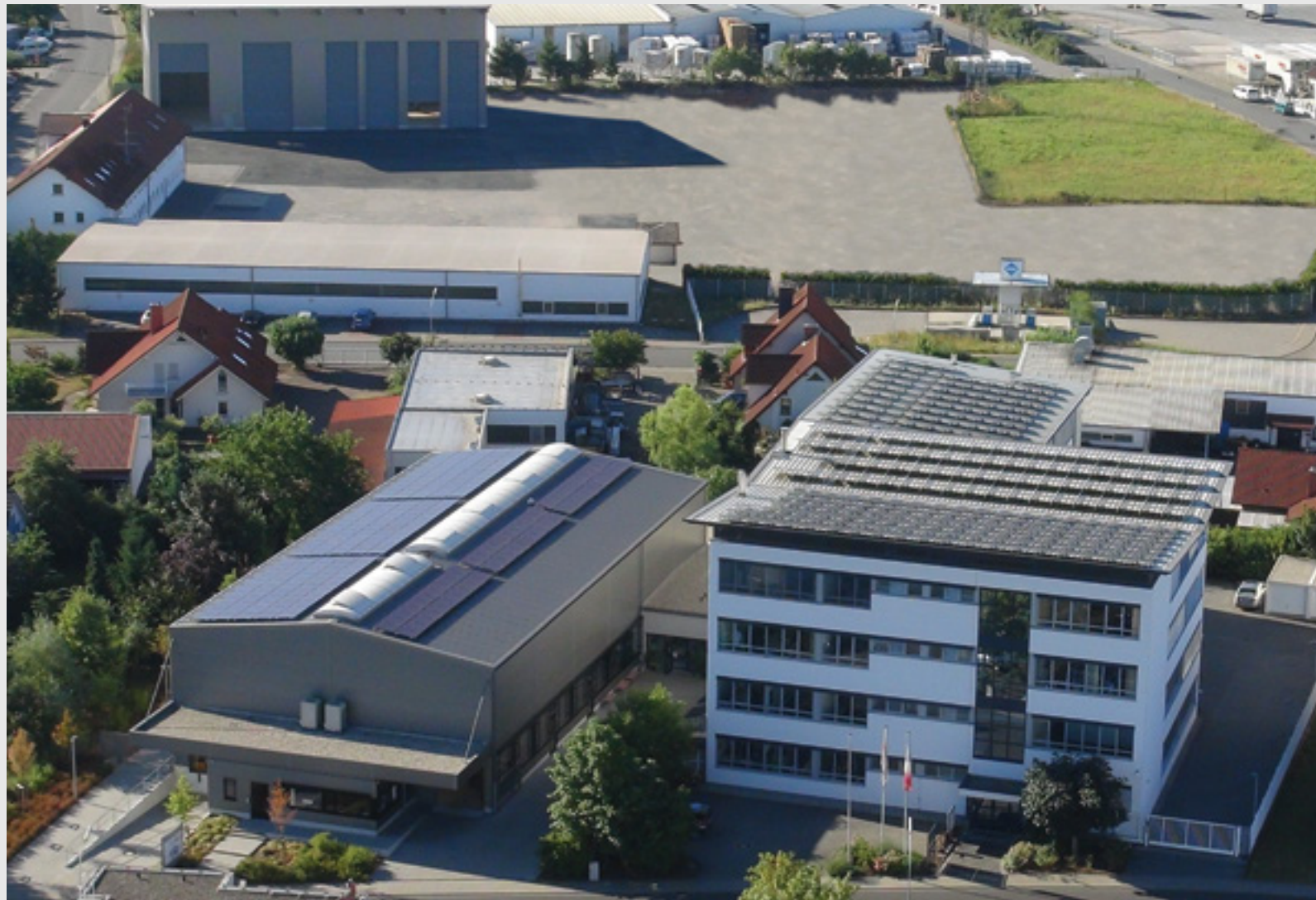
INRO Rohstoffhandel – Firmenzentrale

flexibel – kundenorientiert – nachhaltig